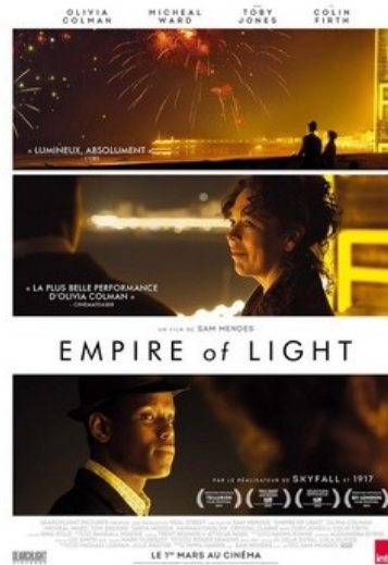
Empire of Light V.O sous-titrée

Séances : - Mercredi 22 mars # 15h - Vendredi 24 mars # 20h30 - Samedi 25 mars # 15h30