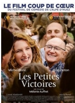
Les Petites Victoires