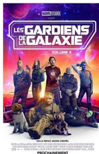
Les Gardiens de la Galaxie