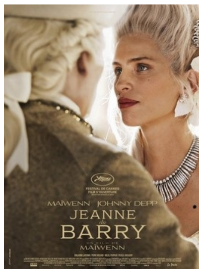
Jeanne du Barry