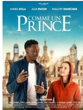
Comme un Prince