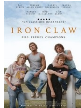
Iron Claw V.F & V.O.S.T

Séances : - Samedi 10 février # 20h30 - Mardi 13 février # 20h30