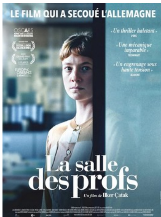
La salle des profs V.O sous-titrée

Après une soirée pleine d'excès, Bénédicte, célèbre chanteuse d'opéra, voit sa carrière s'écrouler. Fatou,