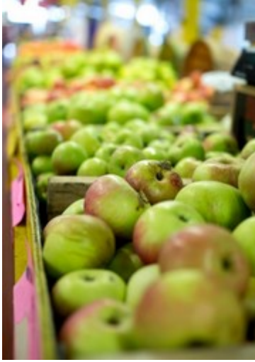
Place de l'église