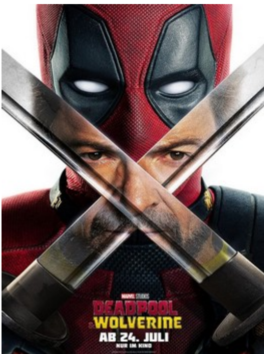
Deadpool & Wolverine V.F & V.O sous-titrée