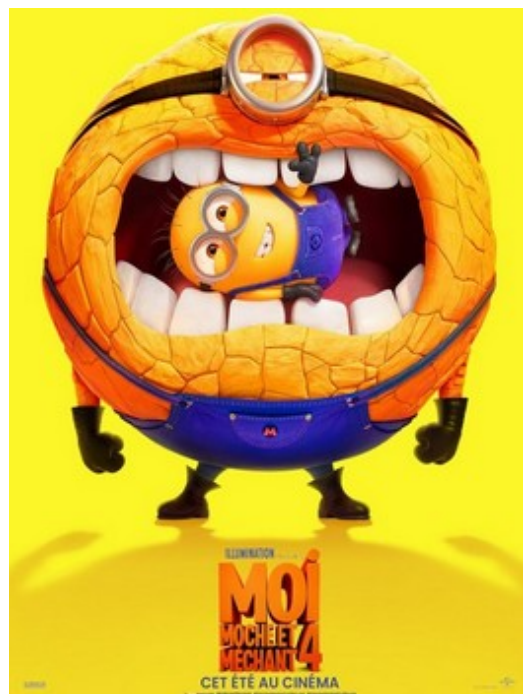
Moi moche et méchant 4