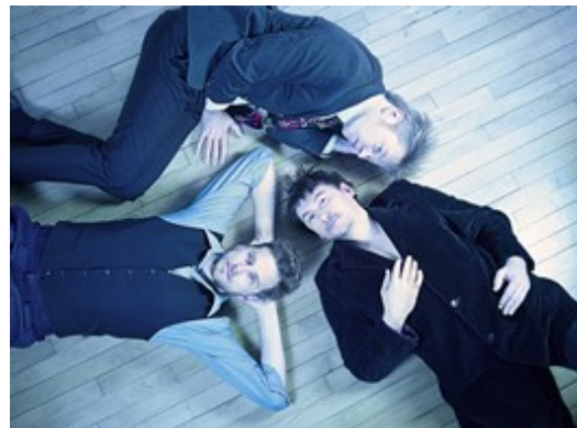
Festival de musiques L'Oreille du Perche - Love of life Mauves-sur-Huisne - Dimanche