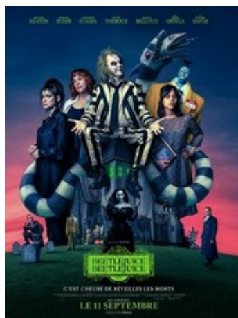
Beetlejuice Beetlejuice V.F & V.O.S.T

Après une terrible tragédie, la famille Deetz revient à Winter River. Toujours hantée par le souvenir de Beetlejuice, Lydia voit sa vie bouleversée lorsque sa fille Astrid, adolescente rebelle, ouvre accidentellement un portail vers l'Au-delà. Alors que le chaos plane sur les deux mondes, ce n'est qu'une question de temps avant que quelqu'un ne prononce le nom de Beetlejuice trois fois et que ce démon