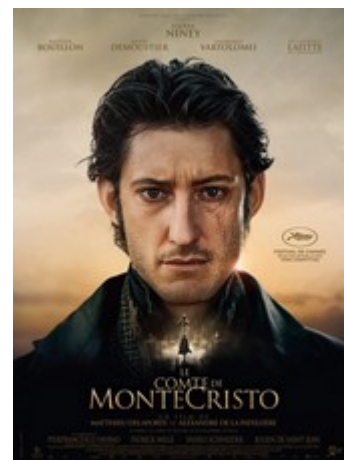
Le comte de Monte-Cristo

Victime d'un complot, le jeune Edmond Dantès est arrêté le jour de son mariage pour un crime qu'il n'a pas commis. Après quatorze ans de détention au château d'If, il parvient à s'évader. Devenu immensément riche, il revient sous l'identité du comte de Monte-Cristo pour se venger des trois hommes qui l'ont trahi.