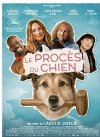
Le procès du chien

Après une terrible tragédie, la famille Deetz revient à Winter River. Toujours hantée par le souvenir de Beetlejuice, Lydia voit sa vie bouleversée lorsque sa fille Astrid, adolescente rebelle, ouvre accidentellement un portail vers l'Au-delà. Alors que le chaos plane sur les deux mondes, ce n'est qu'une question de temps avant que quelqu'un ne prononce le nom de Beetlejuice trois fois et que ce démon