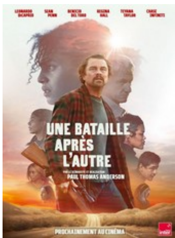
Une bataille après l'autre V.O. sous-titrée

La course d'un ex-révolutionnaire pour sauver sa fille enlevée par un soldat fascisant. Le réalisateur de There will be blood adapte Thomas Pynchon pour regarder l'Amérique dans les yeux.