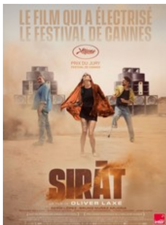
Sirat V.O sous-titrée

Séances : -Mercredi 21 janvier # 15h30 -Samedi 24 janvier # 20h -Mardi 27 janvier # 17h30