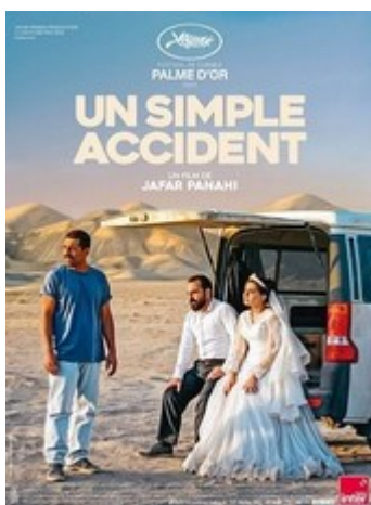
Un simple accident V.O. sous-titrée

Séances : -Jeudi 22 janvier # 20h -Dimanche 25 janvier # 17h45 -Lundi 26 janvier # 14h