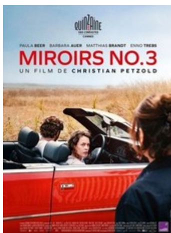
Miroirs NO.3 V.O sous-titrée

En Iran, un banal trajet en voiture mène à un vertigineux engrenage