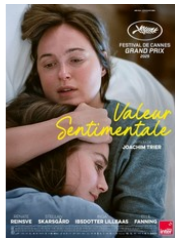
Valeur sentimentale V.O sous-titrée

Séances : -Vendredi 23 janvier # 20h30 -Samedi 24 janvier # 16h