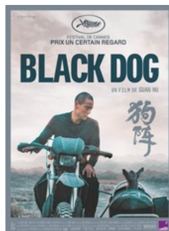
Black dog V.O sous-titrée

Une jeune accidentée est recueillie par une inconnue dans sa maison,