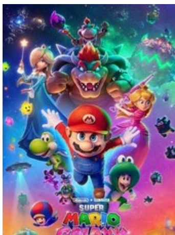
Super Mario Galaxy 2D & 3D

À peine installés au Royaume Champignon, un mystérieux appel à l'aide