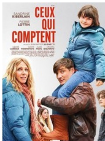
Ceux qui comptent

À peine installés au Royaume Champignon, un mystérieux appel à l'aide