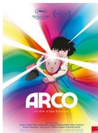
Arco Séance clap ou pas clap?

En 2075, une petite fille de 10 ans, Iris, voit un mystérieux garçon vêtu d'une combinaison arc-en-ciel tomber du ciel. C'est Arco. Il vient d'un futur lointain et idyllique où voyager dans le temps est possible. Iris le recueille et va l'aider par tous les moyens à rentrer chez lui.