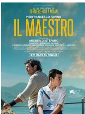
Il Maestro V.O sous-titrée

Ancien révolutionnaire désabusé et paranoïaque, Bob vit en marge de la société, avec sa fille Willa, indépendante et pleine de ressources. Quand son ennemi juré refait surface après 16 ans et que Willa disparaît, Bob remue ciel et terre pour la retrouver, affrontant pour la première fois les