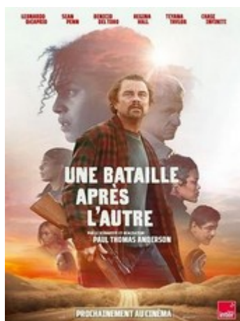
Une bataille après l'autre V.O sous-titrée

Ancien révolutionnaire désabusé et paranoïaque, Bob vit en marge de la société, avec sa fille Willa, indépendante et pleine de ressources. Quand son ennemi juré refait surface après 16 ans et que Willa disparaît, Bob remue ciel et terre pour la retrouver, affrontant pour la première fois les