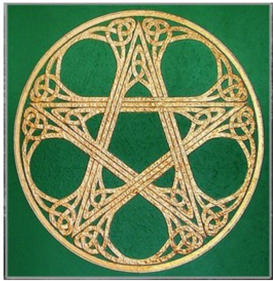
Pascal Couchot Mauves-sur-Huisne

Renseignements : 06 26 73 01 56 / ch.champagne@gmail.com 3, rue de la Forêt