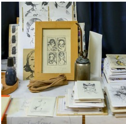
Vincent Rougier Soligny-la-Trappe

Renseignements : 06 50 01 15 48 / jbrengel@loeilsurlalune.fr Ateliers Buguet - 1, rue des Ateliers