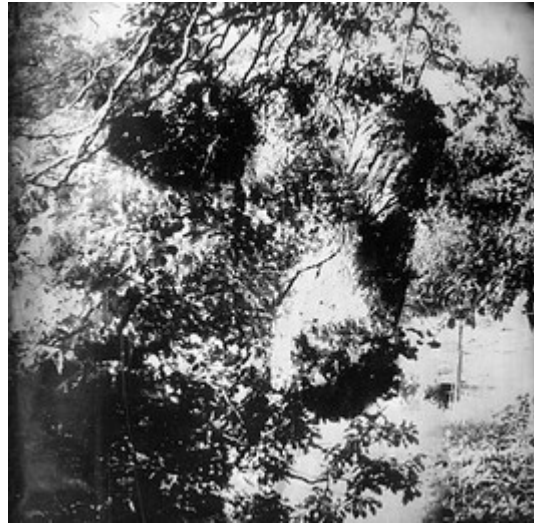
Jean-Baptiste Rengeval La Chapelle-Montligeon

Renseignements : 06 59 63 83 01 / isabelle.petit96@orange.fr Le 7 galerie - 7, rue Sainte-Croix