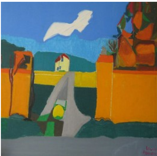
Louis François-Tonnelle La Chapelle-Montligeon

Renseignements : 02 33 83 67 26 / pascal.couchot@gmail.com 122, rue Catinat