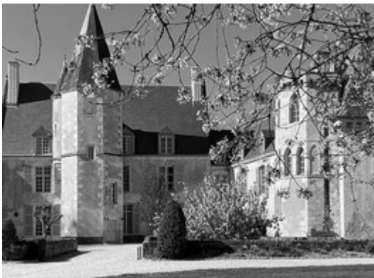
Parcours Art & Patrimoine en Perche - Château de la Pellonnière

https://www.parcoursartetpatrimoineenperche.com/